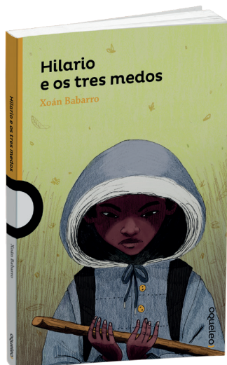
Hilario e os tres medos Xoán Babarro